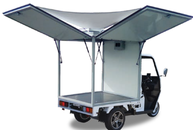
Abbildung zeigt Sonderausstattung gegen Mehrpreis.