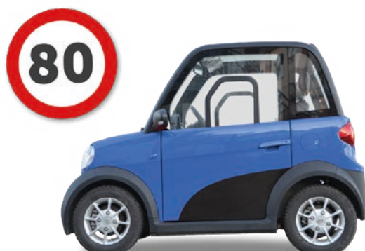
Abbildung zeigt Sonderausstattung gegen Mehrpreis.