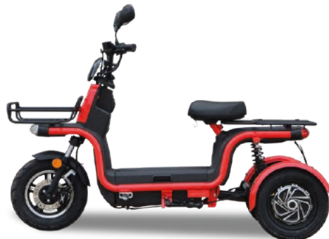
Abbildung zeigt Sonderausstattung gegen Mehrpreis.