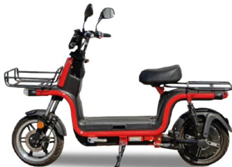
Abbildung zeigt Sonderausstattung gegen Mehrpreis.