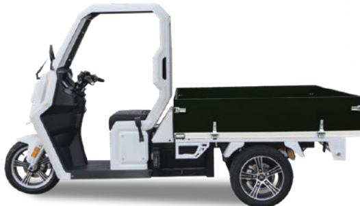
Abbildung zeigt Sonderausstattung gegen Mehrpreis.